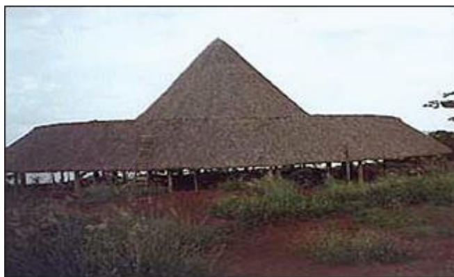
Edificação de madeira com cobertura de fibras vegetais

5.2.1 As fontes de calor que podem inflamar as fibras combustíveis devem ser isoladas e mantidas à distância, mínima, de 5 m.