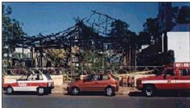
Incêndio em edificação com cobertura de fibras vegetais (ocupação de bar e restaurante)

5.5.4 Recomenda-se a utilização de sistemas de aspersão de água que visam a manter as fibras permanentemente úmidas ou destinadas ao próprio combate das chamas, sem prejuízo das demais medidas constantes desta NT.