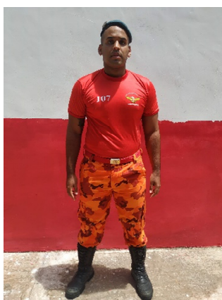
IMAGEM 1 e 2: EXEMPLO DA POSE PARA MODELOS DE UNIFORMES

Deverão ser providenciadas fotos ou imagens coloridas de boa definição e iluminação com militares trajando o(s) uniforme(s) modelos masculino e feminino, enquadrando o corpo inteiro, com vista frontal, em posição militar semelhante à de “descansar”, com o diferencial dos braços que ficam estendidos à lateral do corpo levemente abertos com aproximadamente 7 graus em relação ao corpo (conforme exemplificado nas IMAGENS 1 e 2), porém também sendo aceita a visão perfil caso seja necessário destacar algum detalhe. As fotos devem ser anexadas ao documento de REGISTRO DE SUGESTÃO respectivamente ao lado do campo “Composição da versão masculina” e “Composição da versão feminina”.